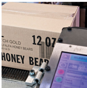
Videojet 2350 imprimant sur des caisses d'expédition