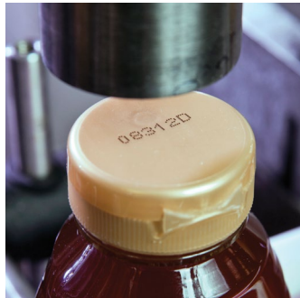
Code au jet d'encre sur bouteille en plastique