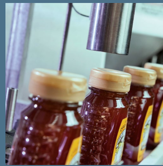
Videojet 1510 imprimant sur une chaîne

Dutch Gold Honey continue à voir de plus en plus d'exigences de codage chaque année et est en mesure de répondre aux besoins de ses clients à mesure de leur évolution. Le système CLARISUITE leur permet de se développer et les reconforte en leur donnant l'assurance que toutes les informations sont correctes et répondront aux besoins de leurs clients.