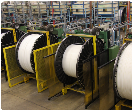
Bobines de tubes dans l'usine Uponor à Apple Valley, Minnesota (États-Unis).

Outre la facilité d'intégration, Videojet a également proposé à Uponor un large choix d'encre. Uponor devait en effet trouver des encres qui adhèrent et résistent à des températures extrêmes et à la durée de vie du tuyau. Grâce aux tests complets - Uponor a dû effectuer 10 à 16 tests internes différents, dont certains ayant pris quatre semaines - Videojet a été à la hauteur des enjeux et a fourni de nombreuses encres pour ces tests afin de trouver celles qui étaient les plus adaptées aux applications uniques d'Uponor.