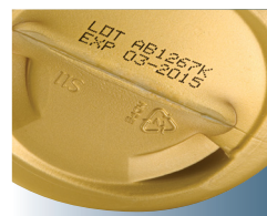
Code noir imprimé par jet d'encre continu sur un flacon de couleur

Videojet propose un service d'impression d'échantillons et peut imprimer plusieurs codes avec différentes technologies sur votre emballage. Le laboratoire vous indiquera la technologie optimale pour l'ensemble de vos emballages et vous enverra les échantillons pour vous aider à prendre une décision éclairée avant d'investir dans une solution de codage.