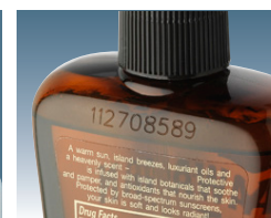
Code imprimé au laser directement sur un vaporisateur