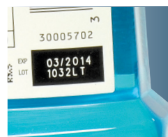
Code imprimé au laser sur une boîte avec ouvertures