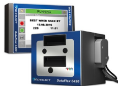
Impresora por transferencia térmica Videojet DataFlex 6420