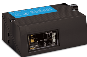
codificadora Videojet 5210

Los sistemas de visión en línea de Videojet-Laetus se integran sin problemas en su línea de producción y el tiempo de configuración es mínimo.