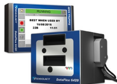
Videojet DataFlex 6420 热转印打码机