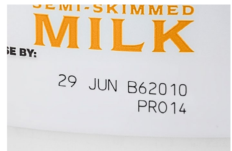
Marcaje reactivo por láser

Para el envasado aséptico de color claro, un enfoque alternativo es incorporar un pigmento sensible al láser en la tinta de recubrimiento cuando se fabrica el envase. Este pigmento normalmente se aplica en una pequeña zona, o parche, en la que se quiere colocar la marca. La energía láser interactúa con los pigmentos y cambia de color para producir un código claro, resistente y permanente.