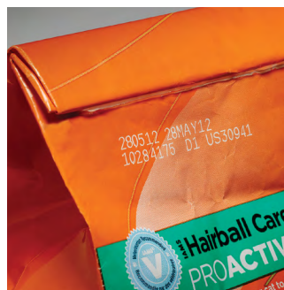
Papel con recubrimiento