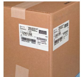
Etiquetado en materiales corrugados