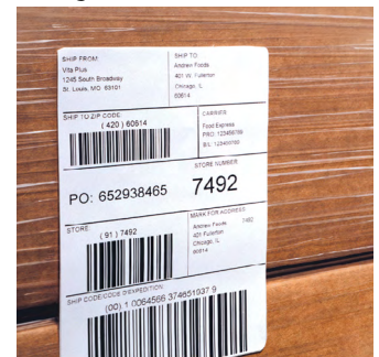
Aplicación de etiquetas sobre envolturas elásticas