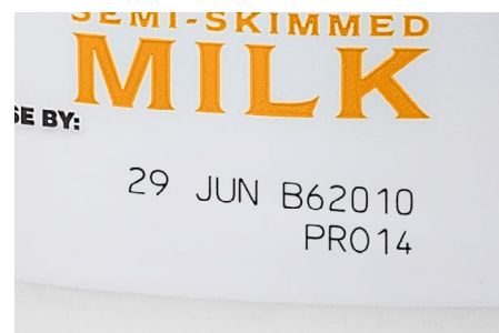
Esempio di marcatura reattiva al laser

Nel caso delle confezioni asettiche con colori chiari, esiste un approccio alternativo: integrare un pigmento ricettivo al laser nell'inchiostro che ricopre la superficie durante la produzione della confezione. Questo pigmento viene di solito applicato esclusivamente su aree circoscritte (o patch), vale a dire quelle su cui si desidera effettuare la marcatura. Grazie a questa soluzione, l'energia del laser può interagire con i pigmenti e modificarne il colore, realizzando in tal modo codici chiari, resistenti e permanenti.