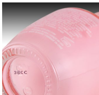
Extrusion – Kunststoff