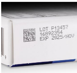
Pharma – Karton