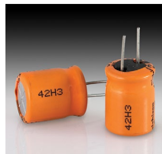
Elektronische Bauteile – Plastik