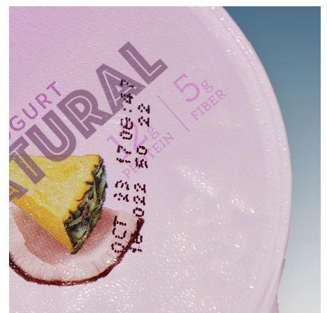
Ejemplos de códigos que obstaculizan el mensaje del producto