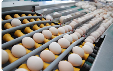
Huevos empezando el procesamiento

Además de tener problemas con su calidad de impresión, las antiguas codificadoras de Sundaily eran difíciles de mantener y necesitaban mucho mantenimiento. La antigua codificadora tenía que limpiarse diariamente y necesitaba un programa de mantenimiento preventivo a intervalos de tiempo relativamente cortos. Además, durante la producción, se tenía de detener la línea casi a diario debido a algún fallo de la codificadora.