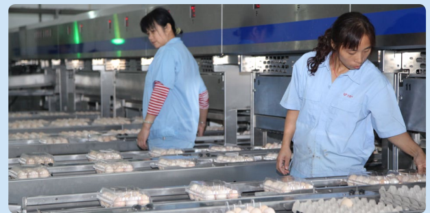
Inspección final de calidad