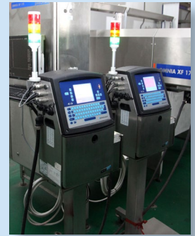
2 codificadoras Videojet 1610 integradas en la línea de producción de Sundaily