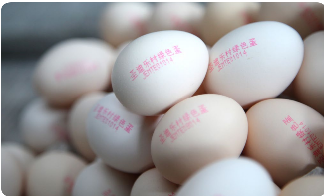
Tinta roja diseñada específicamente para huevos

“Ahora nuestro código se muestra en los huevos nítido y claramente.”