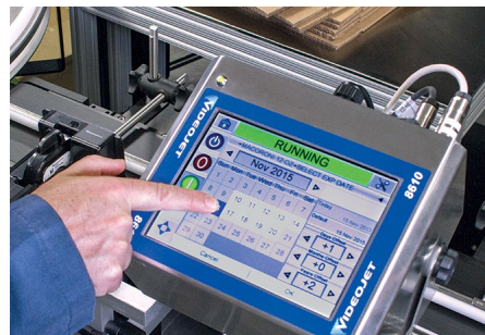
Interfaz CLARiTY™ en las impresoras de Videojet

Además de ofrecer la asistencia y experiencia de una organización internacional, Videojet cuenta con un equipo de expertos en aplicaciones cuyo trabajo consiste en estar al tanto de las tendencias del sector y los retos planteados por las normativas. Videojet puede ofrecer orientación sobre nuevas soluciones de codificado para ayudar a maximizar el proceso de impresión a través de la oferta de soluciones que complementan a su marca y sus envases de productos. Usted se preocupa por su marca y nosotros, por ofrecer soluciones de codificado y marcaje que proporcionen códigos de la máxima calidad por medio de sistemas de alta eficiencia y reducidas necesidades de mantenimiento.