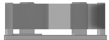
Vista lateral del cassette de cinta de la Videojet DataFlex