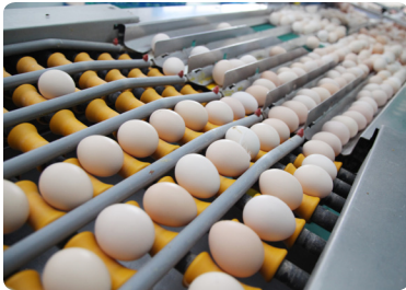
蛋品进入加工流程

除了喷印质量存在问题外，圣迪乐采用的传统喷码机难以保持持续运行，需要进行大量的维护。传统的喷码机必须每天进行清洁，需要在相对较短的时间间隔内进行预防性维护。由于喷码机故障，在生产过程中生产线差不多每隔一天就必须停止运行。