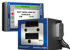
Impressora de transferência térmica Videojet DataFlex 6420