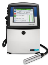
Impressora a jato de tinta contínuo Videojet 1650 UHS

Todas as soluções da Videojet contam com o CLARiTY™ – uma grande interface de usuário intuitiva, touch screen, que facilita o uso e a continuidade para todos os operadores, independentemente da experiência, do conhecimento e da interação com a impressora. Nosso software integrado do CLARiSUITE™ ajuda você a ficar em conformidade com padrões de alimentos das etiquetas e a atender às novas demandas de conteúdo adicional da etiqueta. Ele também oferece recursos de segurança do código para tornar a criação de trabalho, edições e troca de produtos simples e praticamente impossível de obter códigos errados.