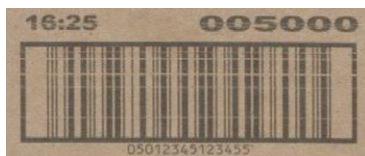
Limpador da cabeça de impressão deslig.