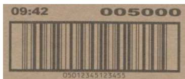
Limpador da cabeça de impressão lig.