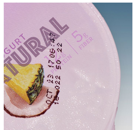
Exemplos de códigos que prejudicam a mensagem do produto