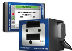
Impresora por transferencia térmica Videojet DataFlex 6420