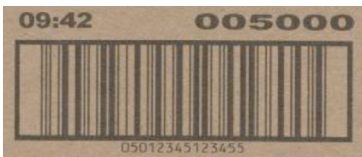
Limpiador de la impresora activado