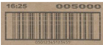
Limpiador de la impresora desactivado