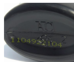
Code imprimé par jet d'encre continu sur un plastique foncé