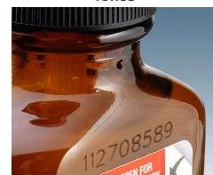
Code laser sur du plastique