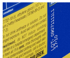
Code laser sur une étiquette en papier